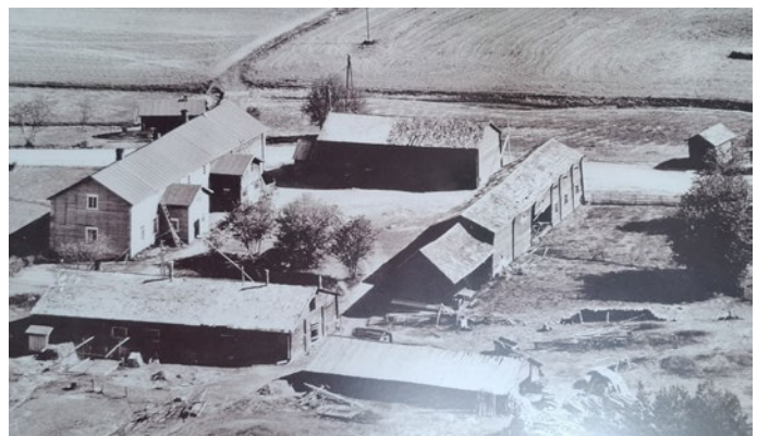
Kaijankosken pihapiiri 1960-luvun alussa.

Juhlatilassa näyttely teemalla "Kylän vanhat kartat"